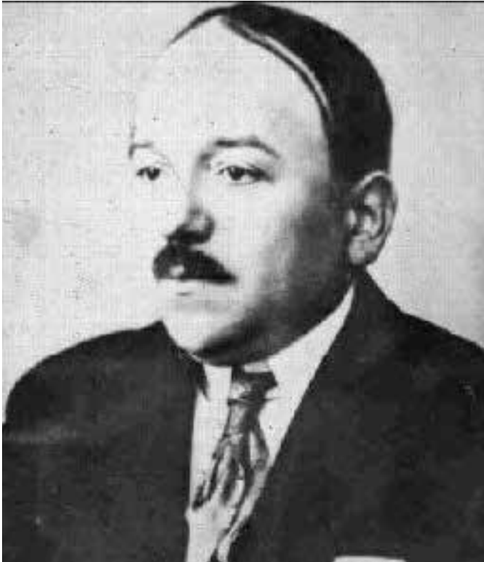
Louis Damblanc père des fusées à étages et maire de Fleurance de 1928 à 1941