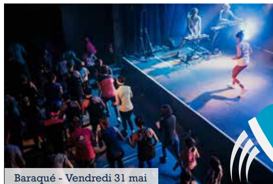
Baraqué - Vendredi 31 mai

Le vendredi 31 mai, dans le cadre de sa programmation culturelle et de son cycle « Olympiades Culturelles et Sportives », la Ville de Fleurance vous propose un spectacle unique, plus que ça, un concert participatif ! Sortez vos shorts et vos baskets, Baraqué vous propose de partager une expérience singulière. Quatre musiciens et une coach de fitness montent ensemble sur scène et vous embarquent dans un véritable bal de sport. Ce spectacle participatif, qui se transforme rapidement en séance de fitness collective et rock n'roll, interroge au passage le culte du corps et la notion d'effort tellement valorisée dans nos sociétés. Vous n'êtes pas très sportif ? Pas d'inquiétude, il sera tout à fait possible de venir assister et encourager les participants !