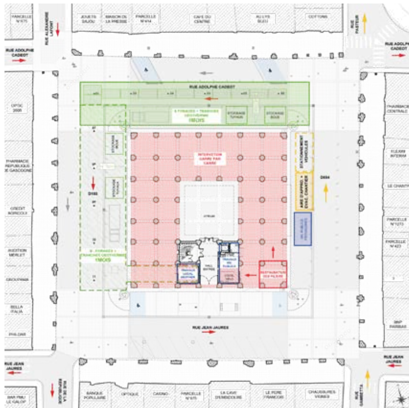
Plan général rez-de-chaussée

Enfin, les piliers ne seront pas en reste puisqu'ils seront aussi rénovés. De nouveaux locaux techniques seront créés en aménageant les deux zones situées de part et d'autre de l'entrée principale de la mairie.