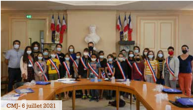
CMJ- 6 juillet 2021

En juin 2021, la Ville de Fleurance mettait en place un Conseil Municipal des Jeunes avec la volonté d'amener une démocratie de proximité pour les jeunes générations de Fleurance. L'objectif était de permettre aux jeunes élus d'agir concrètement pour Fleurance mais aussi de comprendre le fonctionnement de la vie d'une commune et d'exprimer leurs avis sur les projets de la Municipalité.