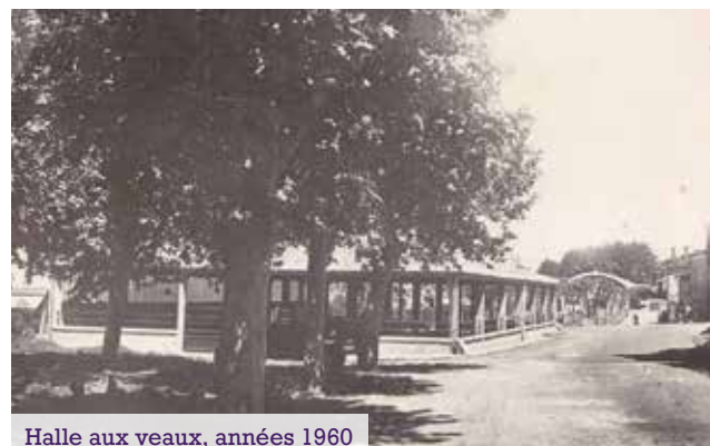
Halle aux veaux, années 1960

Dans les années 1960, sa fonction première était celle d'une halle aux veaux, ouverte, utilisée lors des grands marchés au bétail de Fleurance. Suite à l'effondrement des marchés de plein air, elle sera ensuite fermée (façades remplies) pour en faire un endroit clos et accueillir une halle au gras (volaille) à partir de 1984. Les contraintes sanitaires de ce type marché qui décline pousse la collectivité à y attribuer un autre usage et devient ainsi une salle polyvalente en 2010.