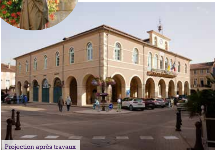
Projection après travaux