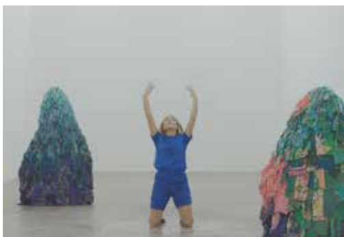
18h - MU - Danse et musique live - 40 min

Deux spectacles seront proposés dans le cadre du cycle « Olympiades culturelles » de la saison culturelle. Ces performances artistiques et sportives seront présentées à la base de loisirs.