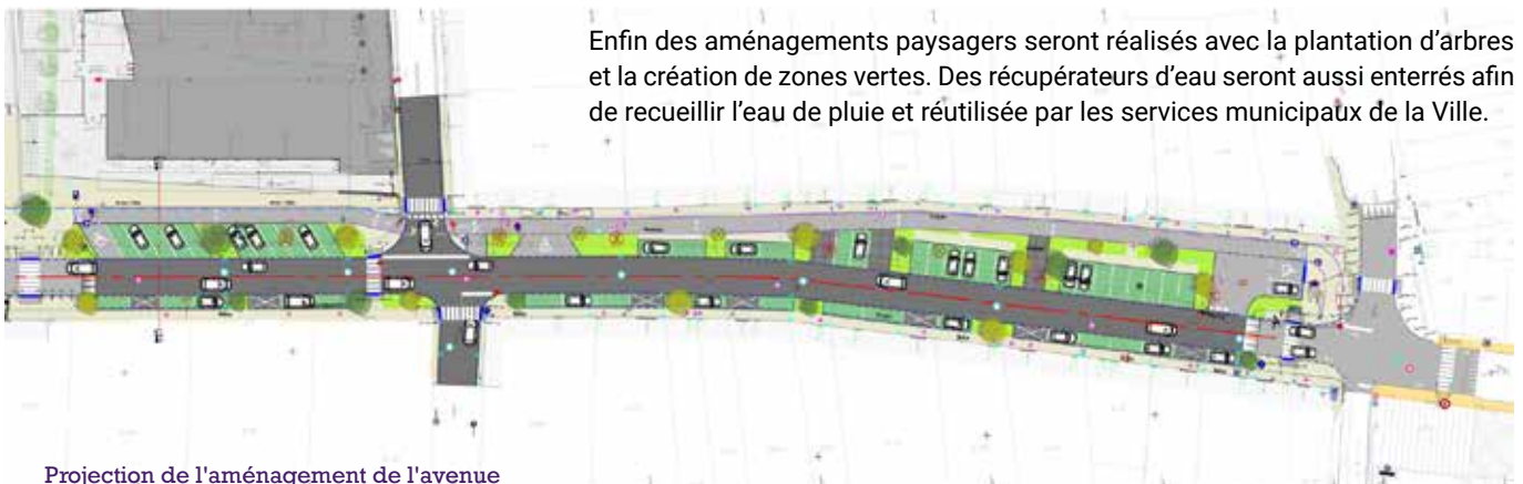
Projection de l'aménagement de l'avenue

Enfin des aménagements paysagers seront réalisés avec la plantation d'arbres et la création de zones vertes. Des récupérateurs d'eau seront aussi enterrés afin de recueillir l'eau de pluie et réutilisée par les services municipaux de la Ville.