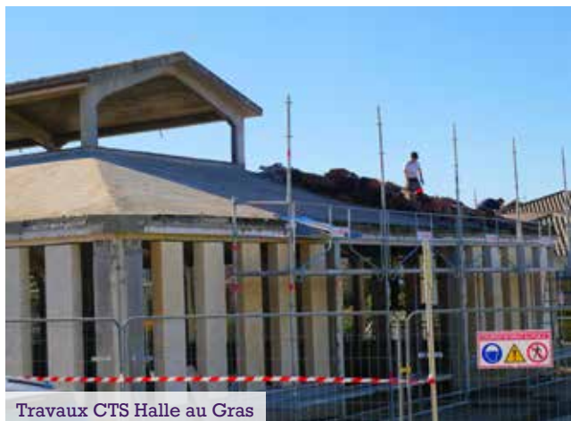
Travaux CTS Halle au Gras

Les travaux ont débuté depuis fin 2023 avec comme première étape le démontage. L'objectif était de mettre le bâtiment à nu afin de revenir à la structure d'origine de la Halle au Gras. Ainsi, le bardage extérieur, l'électricité et la plomberie ont été retirés et seront refaits en respectant les nouvelles normes. Seuls persistent les piliers de la structure ce qui rappelle à certains l'époque des jours de marché sous la halle. Les fondations ont été renforcées et la couverture du toit a été refaite. Les entreprises peuvent ainsi s'attaquer à la reconstruction et surtout l'aménagement du bâtiment.