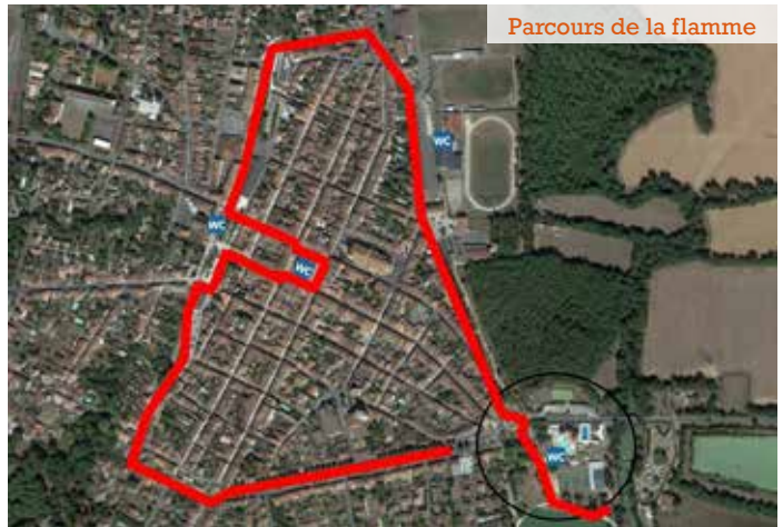
Parcours de la flamme

Un plateau radio interactif permettra d'échanger avec les acteurs du territoire investis pour faire vivre les Jeux partout sur la commune.