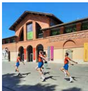
19h - 00:18'15" - Perf. musicale et burlesque