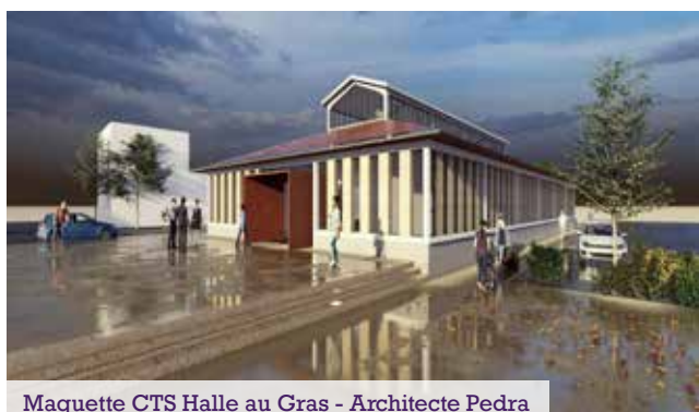
Maquette CTS Halle au Gras - Architecte Pedra