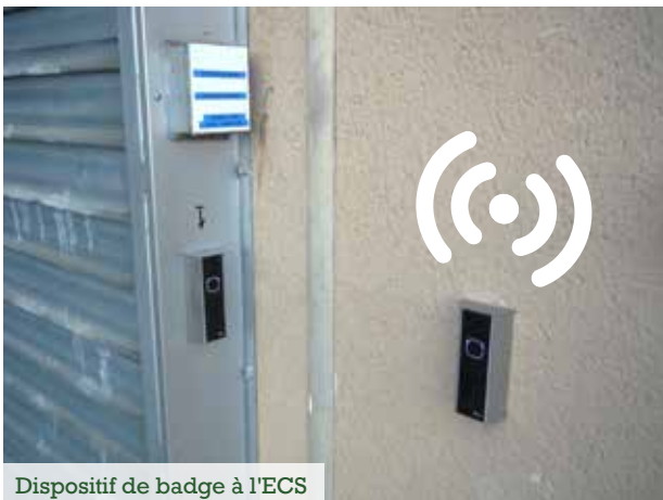
Dispositif de badge à l'ECS

Depuis le début d'année, la municipalité fleurantine a fait installer un système de badge à l'Espace Culturel et Sportif. L'objectif est de permettre aux associations, avec des créneaux prédéfinis et attribués, d'accéder en autonomie au complexe pour leur entraînement. Ainsi, il n'est plus nécessaire qu'un agent municipal ait à se déplacer pour ouvrir et fermer la salle. Le logiciel des badges a été paramétré à chaque utilisateur pour ne laisser l'accès qu'aux périodes réservées et préétablies avec la mairie. Ces nouveaux badges permettent ainsi de rationaliser les accès au complexe et de laisser plus d'autonomie aux utilisateurs réguliers. Les premiers tests semblent très concluants.