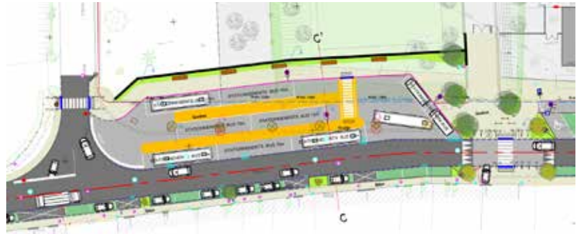
Projection des abords du collège Hubert Reeves

Plus de 350m de voirie seront modernisés avec le remplacement des réseaux humides, mais aussi l'enfouissement du réseau électrique et la mise en place d'un nouvel éclairage public basse consommation.