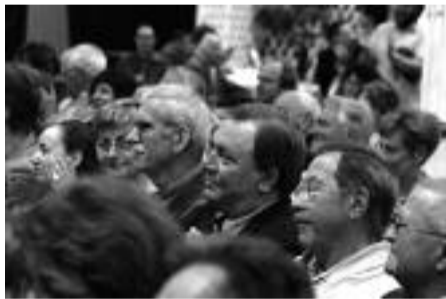
Un débat captivant suivi avec intérêt

"La révolution s'arrête à la perfection du bonheur"