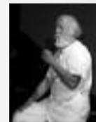
Hubert Reeves, parrain du Festival

Hippodrome Courses de Trot Société Hippique